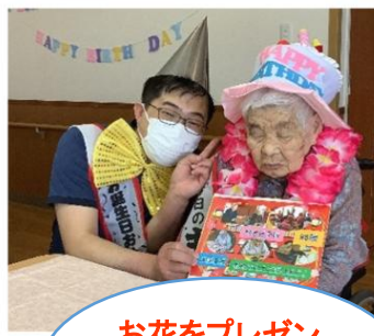
お花をプレゼントされました🌸

3月誕生日のご利用者様の誕生日会を行いました！ 職員が選んだプレゼントとメッセージカードを貰ってとても嬉しそうにされていました♪