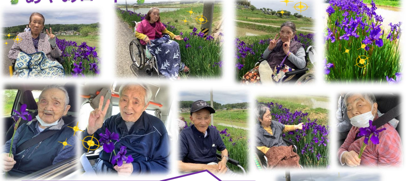
三穂田町の『あやめロード』に行ってきました♪ ちょうど見ごろで、天気も良かったので、絶好のお 出かけ日和でした😊