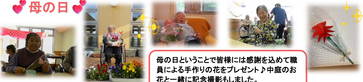
母の日ということで皆様には感謝を込めて職 員による手作りの花をプレゼント♪中庭のお 花と一緒に記念撮影もしました。